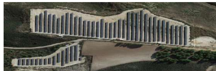
Don Benito, Extremadura.