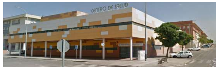
Centro de Salud la Mejostilla Cáceres.