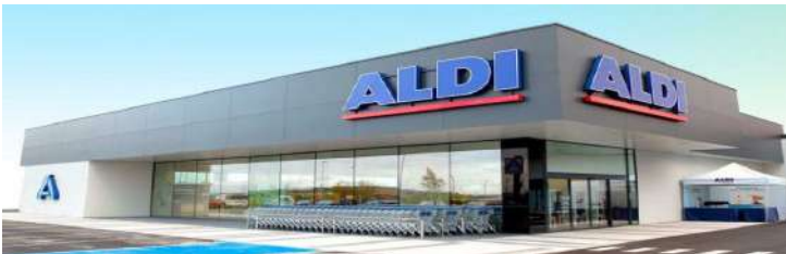
Supermercado ALDI Salamanca.