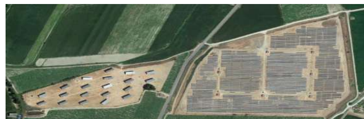
Heras de ayuso, Guadalajara.