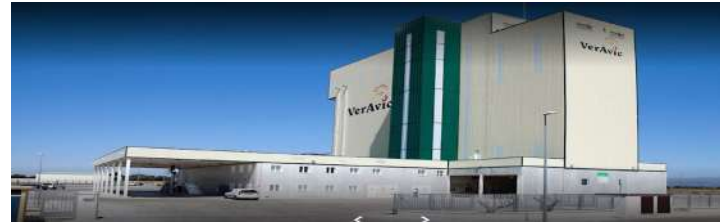
Fabrica de Piensos VerAvic.