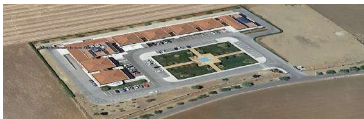
Geriátrico Don Benito.