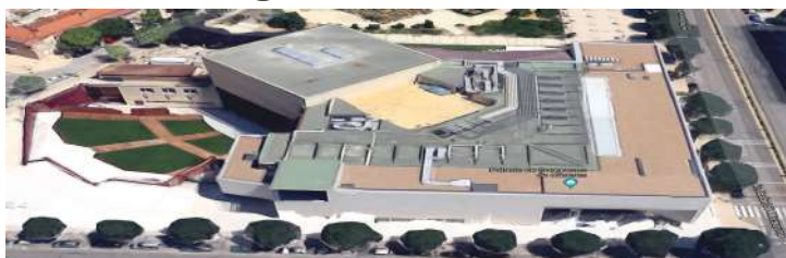
Palacio de Congresos de Cáceres.