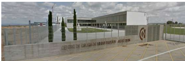
Hospital Mínima Invasión de Cáceres.