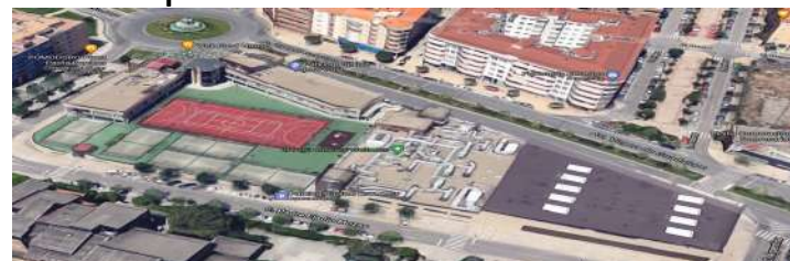
Centro Deportivo El Perú Cáceres.