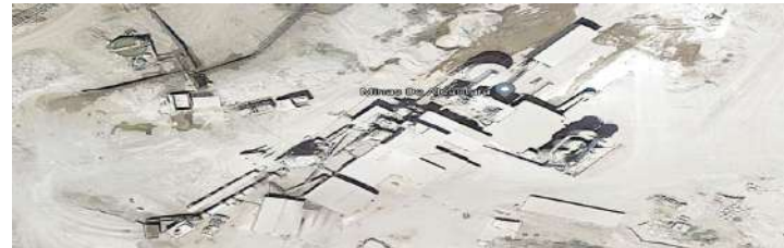
Minas de Alcántara. Minalca