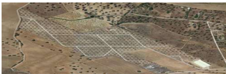
Moheda de Gata, Extremadura.